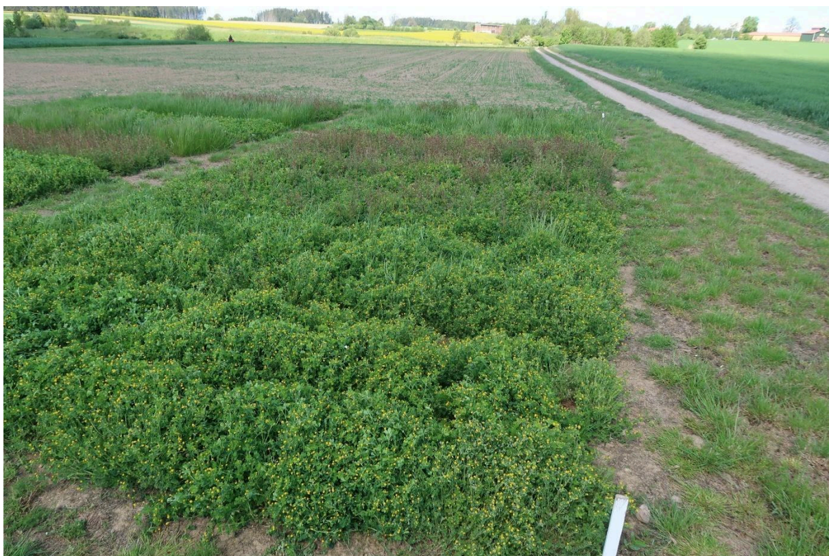
Obr. 20: Pokusné plochy s poloparazity ve Vatíně, vpravo jeden ze zatravněných chodníků, do kterého byl vysetý zdravínek jarní pozdní. 14. 5. 2024.