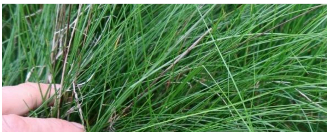
Obr. 17: Kostřava červená byla použita jako hostitel pro zdravínek jarní pozdní.