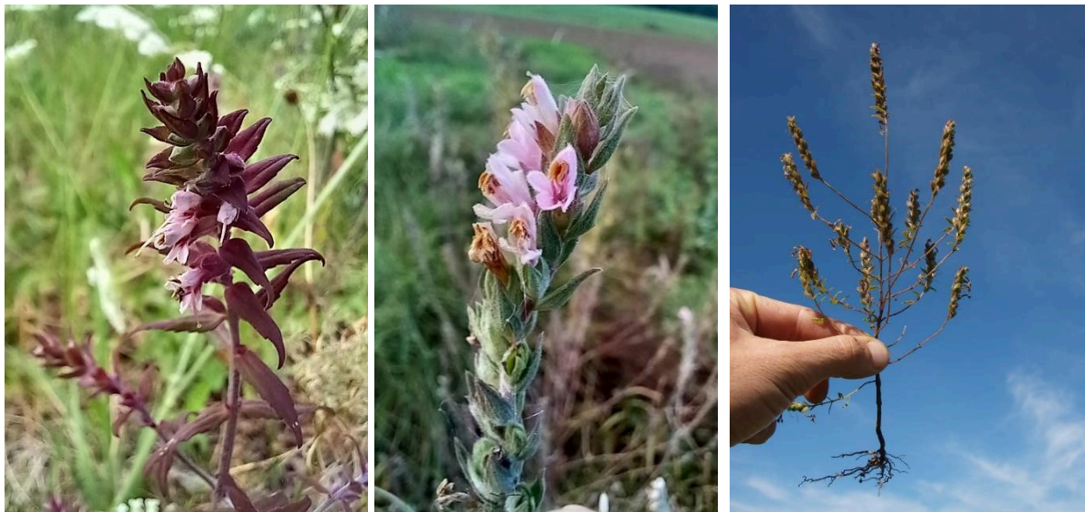
Obr. 1, 2 a 3: Kvetoucí rostliny zdravínku jarního pozdního (vlevo a uprostřed) a zralá rostlina s typickým, slabě vyvinutým kořenovým systémem (vpravo), (foto: S. Hejduk).

Zdravínek jarní pozdní (dále také “zdravínek jarní” nebo “zdravínek”), je jednoletý druh vlhkých a mezofilních luk, pastvin a lesních lemů, popř. slanisek, s nižší produkcí biomasy. Podobně jako u většiny lučních poloparazitů musí jeho semena projít delším obdobím nízkých teplot na povrchu půdy za vlhka a klíčí až na jaře (březen až duben). Vzhledem k malé velikosti semen (1,4–2,0 mm) je počáteční růst semenáčků pomalý, a rostlinky proto vyžadují časnou seč nebo spasení hostitelských rostlin během května, což zajistí pronikání světla k povrchu půdy. Parazituje na širokém spektru hostitelů, nejčastěji na travách, ale i na některých dvouděložných bylinách. Výška rostlin závisí na vitalitě hostitelských rostlin a v příznivých podmínkách dosahuje 40–50 cm. Zdravínek vytváří kopinaté listy s pilovitými okraji. Při opakované seči a v méně příznivých podmínkách (sucho, nedostatek živin) dorůstá pouze 10–15 cm. Oproti většině jiných poloparazitů kvete pozdě, nejčastěji od července do konce září. Květy jsou drobné a nenápadné, růžovofialové barvy (Obr. 1 a 2). Semena dozrávají během září až na začátku října (Obr. 3). S ohledem na svou malou velikost jsou semena šířena do okolí i větrem.