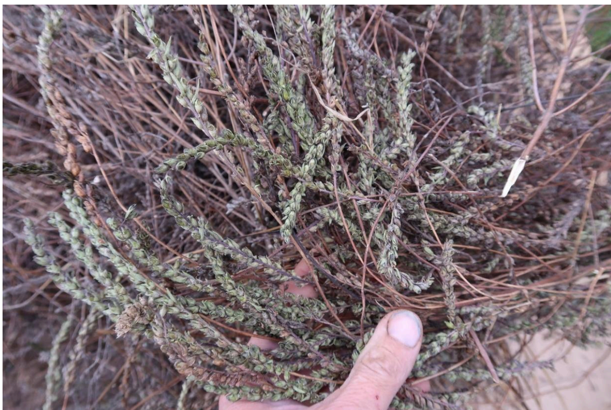
Obr. 9: Vysušené rostliny zdravínku jarního pozdního před výmlatem semen.

Osivo zdravínku bylo sbíráno na okraji města Mikulov (48.8195119N, 16.6448531E) dne 18. 9. 2023. Hmotnost tisíce semen u zdravínku z této lokality měla hodnotu 0,24 g a po vysušení (Obr. 9), vymláčení a vyčištění bylo k dispozici 220 g semen (Obr. 10) pro založení pokusných ploch.