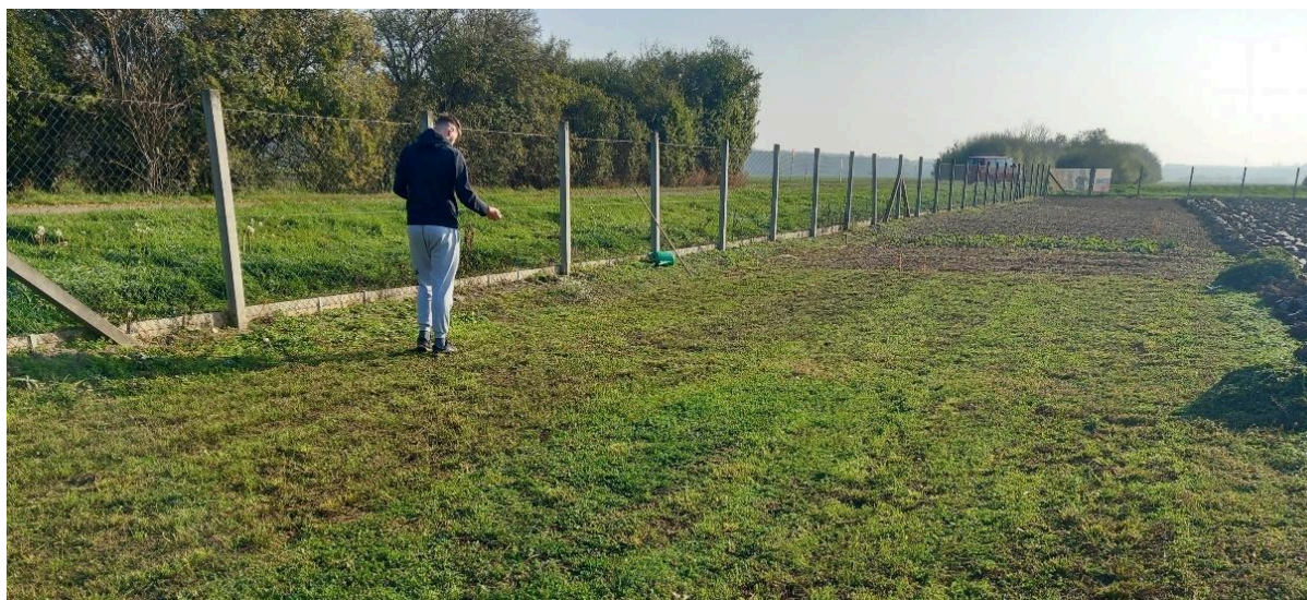
Obr. 25: Pokusná plocha po posečení a opakovaném přisevu černýše rolního. Žabčice, 8. 11. 2024.

Pro ověření semenářské produkce ve druhém roce vegetace byly pokusné plochy 7. listopadu 2024 posečeny a vyhrabány a na každou parcelu bylo znovu vyseto 100 semen černýše rolního na 1 m 2 (obr. 21). Na parcelách byl zaznamenán vysoký počet semenáčků krvavce menšího z výdrolu a menší podíl semenáčků tolíce dětelové. Současně byla ve stejný den založena jedna plocha o velikosti 4 m 2 s ozimou pšenicí ( Triticum aestivum , výsevek 20 g/m 2 ), a do ní byl současně přisetý černýš (výsevek 2 g/m 2 ).