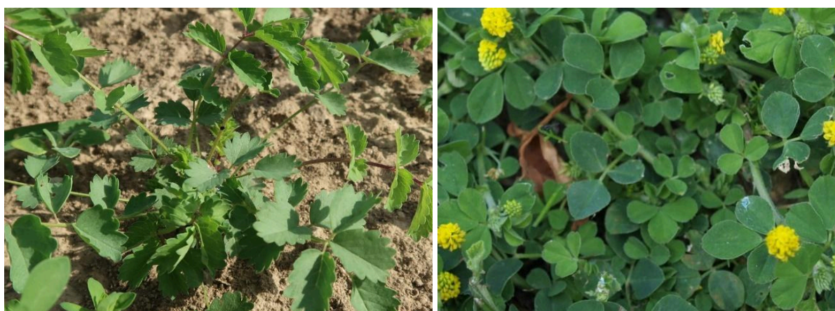
Obr. 15 a 16: Krvavec menší (vlevo) a tolice dětelová (vpravo) mohou sloužit jako další hostitelské rostliny pro černýš rolní.