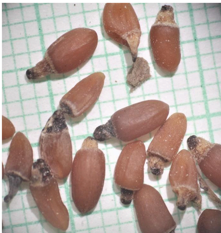
Obr. 7: Semena černýše rolního. Jako podklad pro posouzení velikosti je použit list papíru s milimetrovou mřížkou.

Semena černýše rolního jsou poměrně velká (hmotnost tisíce semen, dále HTS, je v rozmezí 8–15 g) a nejsou vybavena ústrojím pro šíření větrem (chmýr ani blanitý lem). Je na nich ale vytvořeno tzv. masíčko (elaiosom), které slouží k šíření mravenci (Obr. 7). Barva semen je béžová až červenohnědá a skladováním se postupně mění do černé. Jejich velikost je poměrně variabilní i v rámci sběru na jedné lokalitě, protože nedozrálá semena mají výrazně menší velikost. Čištěním lze samozřejmě drobná semena odstranit, a tím zvýšit hodnotu HTS.