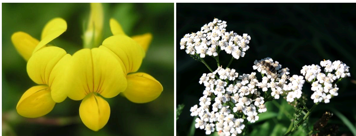
Obr. 13 a 14: Štírovník růžkatý (vlevo) a řebříček obecný (vpravo) představují hostitelské rostliny pro černýš rolní.