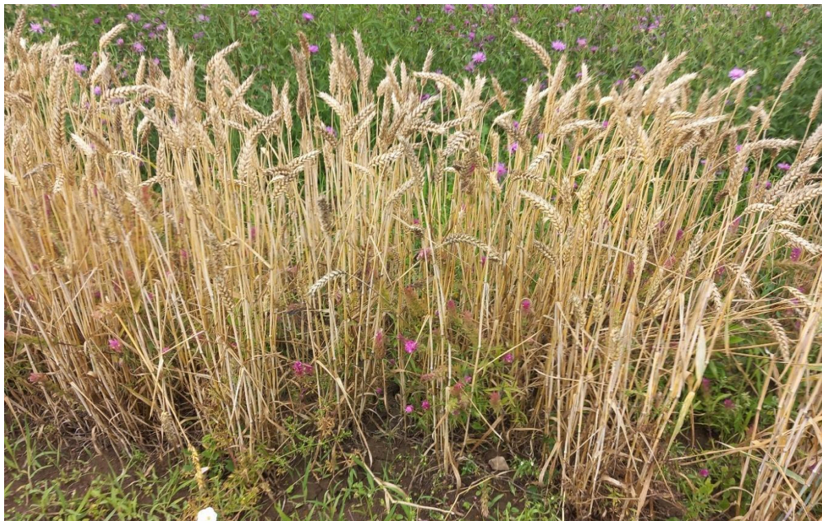
Obr. 30: Dozrávající porost pšenice s dokvétajícími rostlinami černýše. Žabčice, 9. 7. 2025.

Dne 20. 6. 2025 byla vyhodnocena pokryvnost černýše a pšenice a jejich výšky. Pšenice dosahovala průměrné výšky 67 cm a pokryvnosti 60 %, zatímco rostliny černýše byly vysoké 40 cm a dosahovaly pokryvnosti 10 %. I když byl porost pšenice poměrně řídký a světlo pronikalo k černýši i ze stran (šířka parcely byla pouze 1 m), byly rostliny slabé, vytáhlé a kvetly mnohem méně než v porostech dalších testovaných hostitelů.