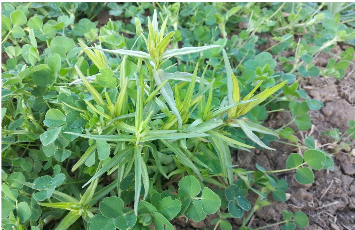
Obr. 24: Shluk vzcházejících rostlin černýše rolního v tolici dětelové. Žabčice, 17. 4. 2024.