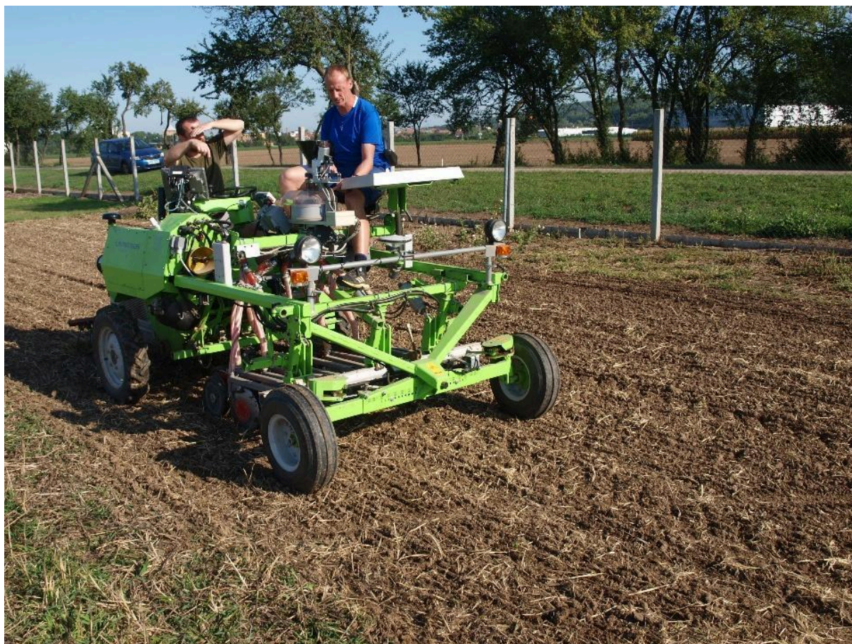
Obr. 18: Zakládání porostů hostitelských rostlin na Polní pokusné stanici Mendelovy univerzity v Brně v Žabčicích, 15. 9. 2023.

Druhá pokusná plocha s hostitelskými druhy na Polní pokusné stanici v Žabčicích byla založena 15. 9. 2023 (Obr. 18). Předplodinou byla ozimá pšenice ošetřená herbicidem HUSAR STAR (účinné látky iodosulfuron-methyl Na + thienkarbazone-methyl). Vzhledem k lokalitě nevhodné pro pěstování zdravínku zde byly vysety pouze hostitelské druhy pro černýš rolní. Bylo zde založeno 12 pokusných ploch po 10 m 2 bez variant s kostřavou červenou. S ohledem na výrazné sucho po výsevu musely být pokusné plochy opakovaně zavlaženy. Seznam variant hostitelských rostlin je uveden v Tab. 1. Nebyla zde vyseta kostřava červená, protože z pozorování v přírodě je známo, že není vhodným hostitelem černýše rolního. Výsevky hostitelů byly použity stejné, jako ve Vatíně.