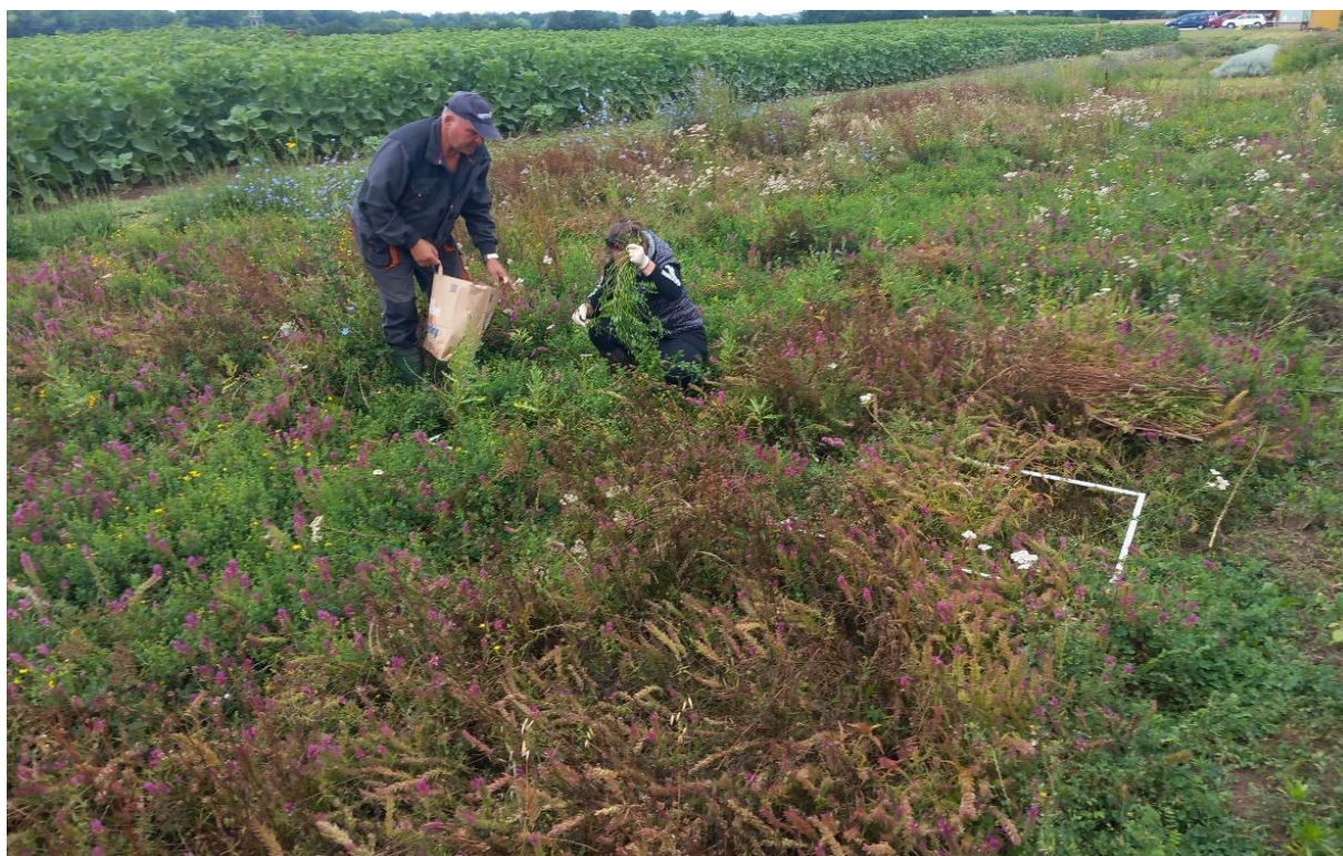
Obr. 29: Sklizeň vzorků dozrávajících porostů černýše rolního z jednotlivých variant hostitelských rostlin v Žabčicích dne 9. 7. 2025.