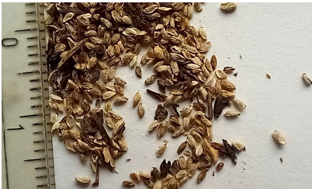
Obr. 10: Drobná semena zdravínku jarního pozdního.