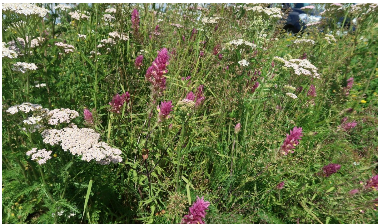
Obr. 22: Varianta s černýšem rolním na hostitelské rostlině řebříčku obecném. Vatín, 14. 5. 2024.