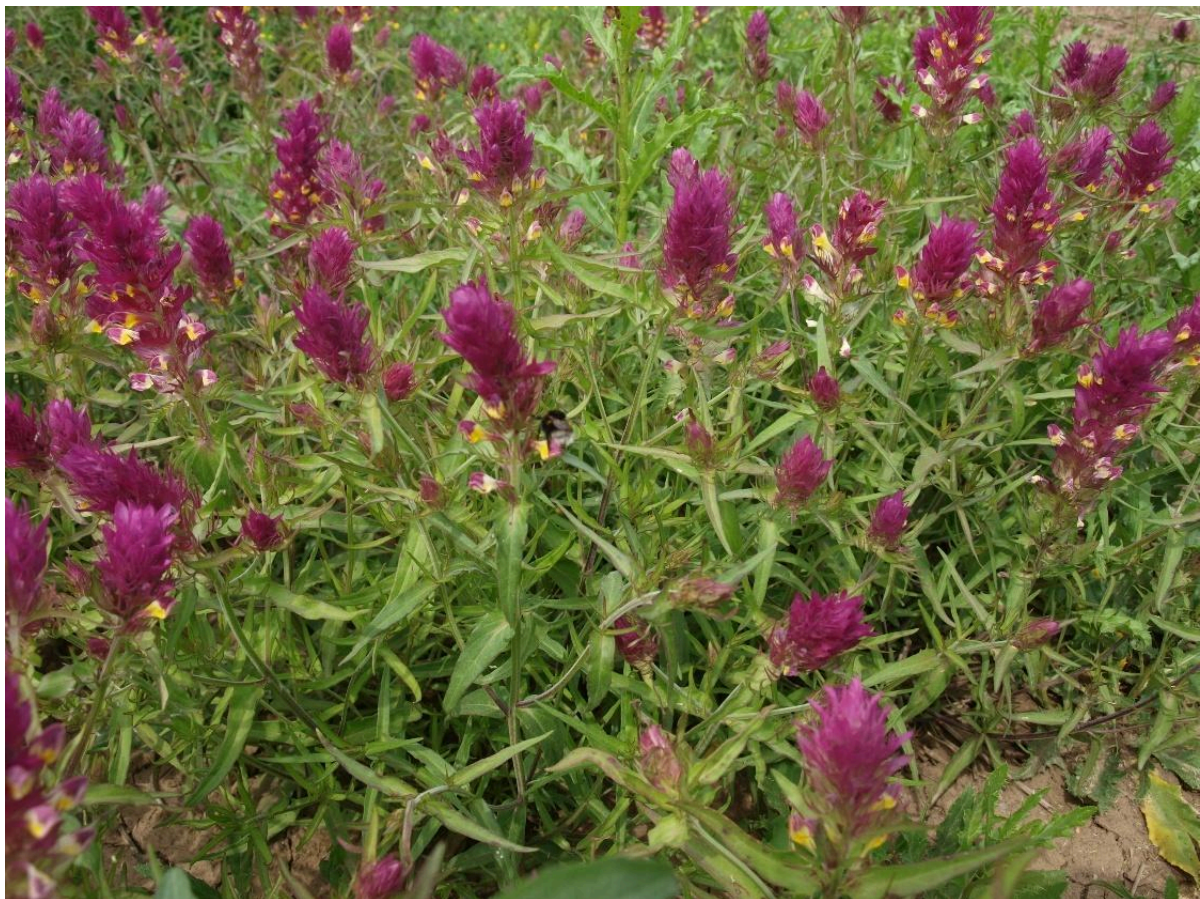
Obr. 5: Kvetoucí rostliny černýše rolního. Žabčice, 4. 6. 2020.