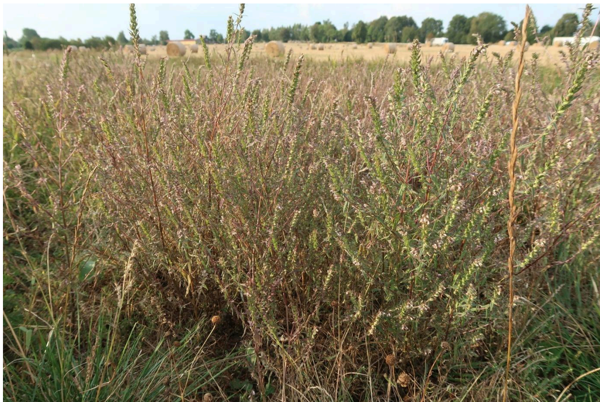
Obr. 23: Dozrávající porost zdravínku jarního pozdního. Vatín, 29. 8. 2024.

Po sklizni osiva poloparazitů byly porosty hostitelů ponechány bez zásahu do listopadu, kdy byly posečeny a biomasa byla odstraněna. Následně bylo do stejných pokusných parcel jako v předchozím roce přiseto poloviční výsevni množství osiva oproti roku 2023 (1 g/m 2 černýše což odpovídá přibližně 100 semenům na 1 m 2 a 0,5 g/m 2 zdravínku = cca 2200 semen/m 2 ).