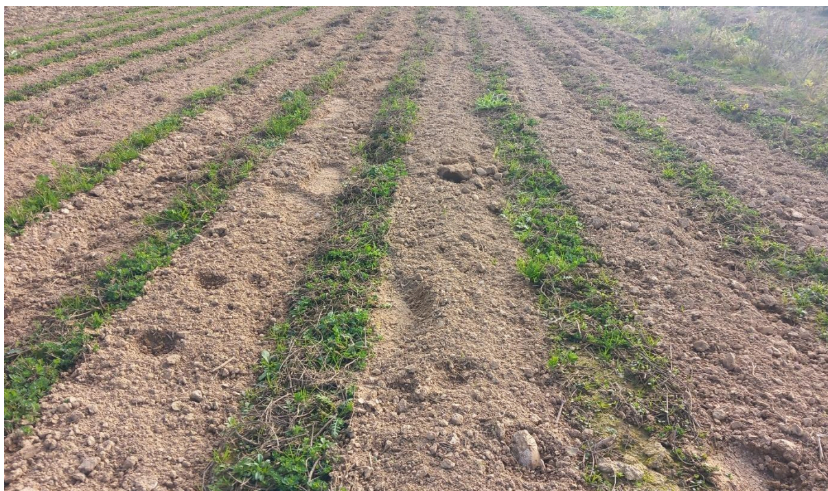
Obr. 32: Širokořádkový porost štírovníku do jehož meziřadí (45 cm) byl vysetý černýš rolní. Markvartice u Sobotky, 4. 11. 2024.

V roce 2025, v důsledku suchého průběhu jara, vzešly oba přiseté poloparazitické druhy nerovnoměrně. Přestože byl černýš rolní vysetý do širokého meziřadí hostitelského porostu dvouletého štírovníku růžkatého, začal štírovník v květnu 2025 poloparazita přerůstat a zastiňovat. Proto bylo nutno přistoupit k posečení hostitele na vyšší výšku strniště tak, aby nebyly poškozeny rostliny černýše. Přesto štírovník znovu rychle zregeneroval a začal zastiňovat rostliny černýše (Obr. 33). To způsobilo jejich velký výpadek a v době zrání černýše zůstávala jen přibližně 1 slabá rostlina na 1 m 2 . V důsledku této nízké hustoty byly nakonec jednotlivé rostliny černýše sklizeny ručně, aby se co nejvíce snížily ztráty jeho semen. Celkově bylo z plochy 500 m 2 sklizeno pouze 300 g semen černýše, což bylo méně, než bylo vyseto. To ukazuje úskalí, které je spojeno s množением osiva tohoto poloparazita. Ačkoliv se štírovník růžkatý v prvním roce vegetace v roce 2024 v Žabčicích projevil jako jeden z nejvhodnějších hostitelů, ve druhém užitkovém roce, kdy rostliny zesílily a rostly v důsledku vyvinutého kořenového systému mnohem agresivněji, dokázal mladé rostliny černýše silně zastínit a snížit jejich početnost na minimum. Řešením by mohlo být výrazné snížení výsevu štírovníku nebo mechanické poškození porostu štírovníku před výsevem černýše na podzim, aby se snížila hustota rostlin a nedošlo k tak výraznému zastínění poloparazita v následujícím roce.