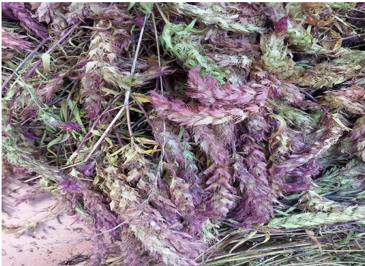
Obr. 8: Dosoušení nasbíraných rostlin černýše rolního z lokality Dunajovické kopce, 4. 7. 2024.

Vzhledem k tomu, že v následujícím roce nebylo sklizeno dostatečné množství osiva pro založení provozních množitelských ploch, byly dne 3. 7. 2024 na lokalitě Dunajovické kopce nasbírány tři velké papírové pytle dozrávajících rostlin černýše o celkovém objemu cca 160 l, ze kterých bylo po jejich vysušení získáno 1100 g osiva.