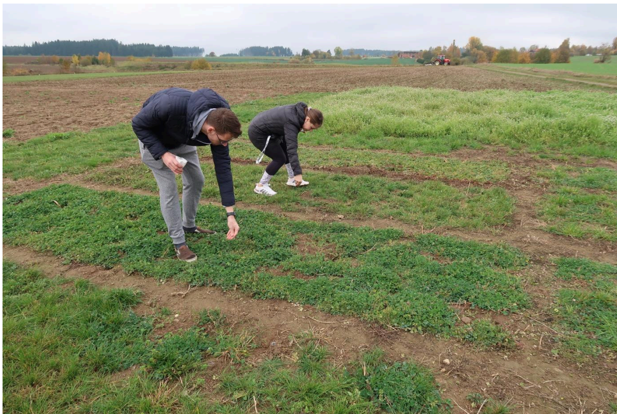
Obr. 19: Výsev poloparazitů do hostitelských druhů a jejich směsí na Výzkumné pícninářské stanici ve Vatíně, 30. 10. 2023.

Ve Vatíně byly vysety oba druhy poloparazitů ručně dne 30. 10. 2023 (Obr. 19). Ve stejný den byl opět ručně vyset v Žabčicích do vzešlých hostitelů černýš rolní. Pro černýš byl použitý výsevek 200 semen na 1 m 2 , pro zdravínek 4000 semen na 1 m 2 .