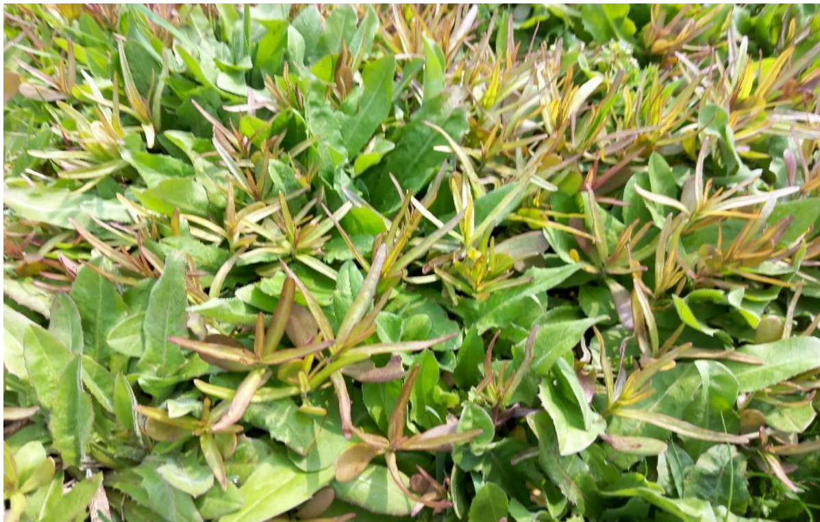
Obr. 4: Vzcházející rostliny černýše rolního s nafialovělými listy v čekance obecné ( Cichorium intybus). Hrušovany u Brna, 4. 4. 2025.

Podobně jako u zdravínku jde o jednoletý druh, který ale preferuje sušší, slunná stanoviště. Dokáže však růst i na vlhkých zamokřených místech v teplých polohách. V minulosti byl běžným plevelným druhem v obilninách. Jeho semena bylo obtížné ze sklizeného zrna vyčistit a následně kontaminovala mouku a způsobovala její tmavé zbarvení (odtud jeho český název). Intenzifikace zemědělství (používání herbicidů a vyšších dávek minerálních hnojiv) současně s dokonalejšími technologiemi čištění osiva obilnin způsobily jeho vymizení z orné půdy. Na rozdíl od ostatních poloparazitů semena klíčí už na podzim, ale rostliny vzchází až během března a dubna následujícího kalendářního roku (Obr. 4). Jeho semena jsou mnohem větší (5,5–7,0 mm) než u zdravínku i kokrhelů, a proto je počáteční růst poměrně rychlý. Nakvétá postupně, přibližně od poloviny května do poloviny července. I v době, kdy už vypadávají první zralá semena, můžeme na stejné rostlině najít rozkvetlé květy. Rostliny na zastíněných stanovištích nebo v hustých porostech hostitelů jsou slabé a vytváří jen minimum květů, nebo někdy vůbec nekvetou a dochází zde také k vysokému úhynu semenáčků. Jako hostitele preferuje dvouděložné rostliny.