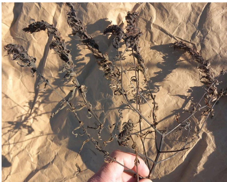
Obr. 28: Část kvetoucích rostlin černýše rolního nebo celé rostliny často předčasně usychají, zřejmě v důsledku neznámé houbové infekce, což vede k výraznému snížení produkce osiva. Hlavní stonek je ukousnutý zřejmě srnčí zvěří, 2. 7. 2024.

Pokusné plochy ve Vatíně byly 6. 11. 2024 přisety 1 g/m 2 osiva černýše (cca 115 semen/m 2 ), aby se posílila jeho populace z vypadaných semen v následujícím roce. Porosty nebyly v roce 2025 hnojeny a pouze se udržovaly 20 cm široké uličky mezi parcelami. Následně byly v červnu spočítány rostliny na jednotlivých parcelách a 13. 8. 2025 byly zralé rostliny černýše odřezány i s hostiteli z plochy 1 m 2 a vysušeny pro získání informace o produkci celkové biomasy a potenciálním výnosu osiva (Tab. 6).