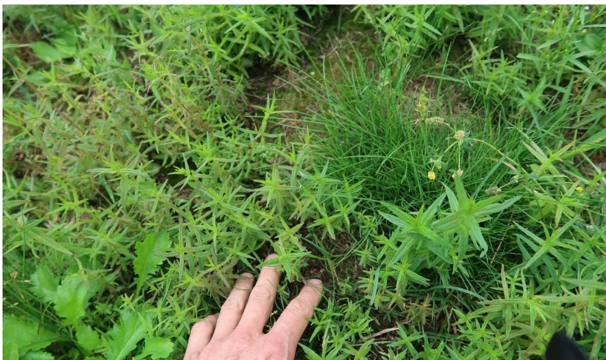
Obr. 21: Rostliny zdravíneku jarního pozdního rostoucí na trávníku z lipnice luční a jílku vytrvalého po jeho předchozím mulčování. Vatín, 22. 7. 2024.