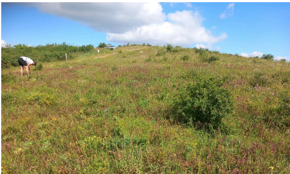
Obr. 6: Sběr rostlin černýše rolního se zralými semeny na lokalitě Dunajovické kopce, 2. 7. 2024.

Semena černýše byla v letech 2023 a 2024 sbírána během července. Protože semena černýše dozrávají nerovnoměrně a po dozrání snadno vypadávají, byly sbírány celé rostliny a opatrně ukládány do papírových pytlů k převozu na dosušení. Vzhledem ke slabě vyvinutému kořenovému systému lze rostliny snadno vytrhávat z půdy (rychlejší metoda ale složitější čištění osiva od hrudek těžší půdy), nebo je možno odřezávat nebo odstříhovat stonky nad zemí. Během sběru rostlin bylo na zemi patrné značné množství již vypadaných semen a současně byla v tobolkách ještě nedozrálá semena.