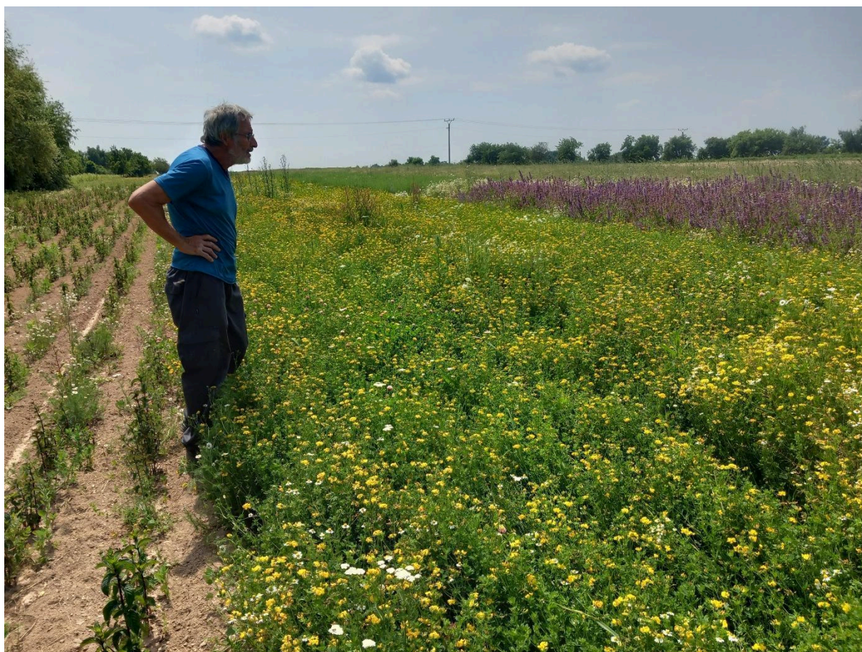
Obr. 33: Kvetoucí porost štirovníku růžkatého s přisetým černýšem rolním. Markvartice u Sobotky, 18. 6. 2025.