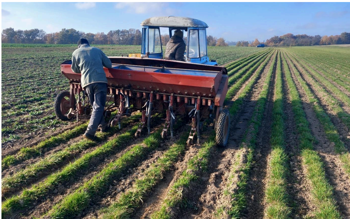
Obr. 31: Výsev zdravínku jarního do trávy tomky vonné secím strojem Saxonía. 4. 11. 2024.